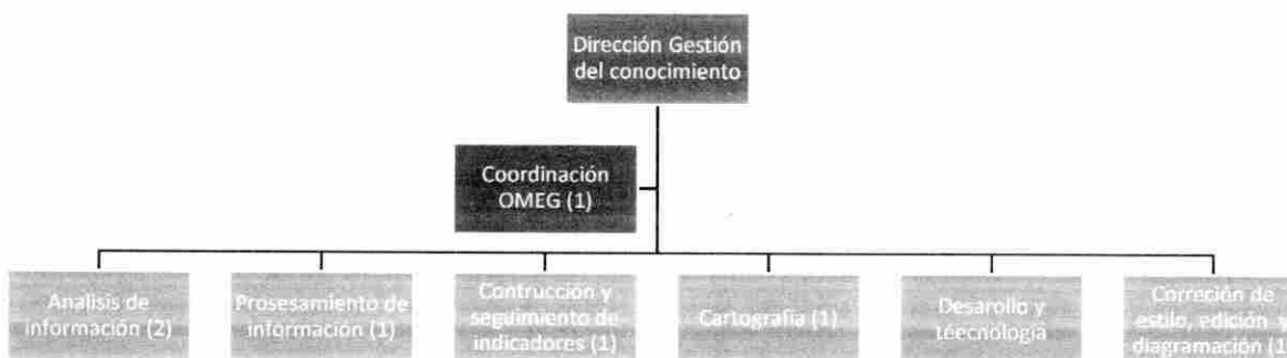
Figura 1: Estructura del OMEG

A continuación, se describe el objetivo de cada uno de los procesos que componen la estructura del OMEG.