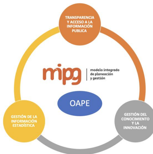
Ilustración 3. Observatorio de Acceso y Permanencia Escolar y MIPG