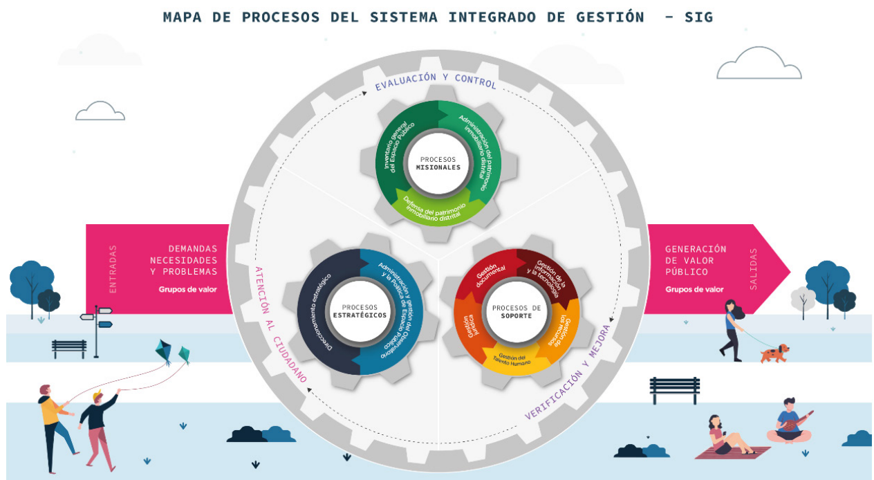
Imagen 2. Mapa de procesos de la entidad.

El grupo de Administración y Gestión del Observatorio y la Política de Espacio Público de Bogotá en la Defensoría del Espacio Público, es el que da cumplimiento a esta meta, proceso que se conformó desde el año 2019 como uno de los más estratégicos de la entidad (Ver anexo 1).