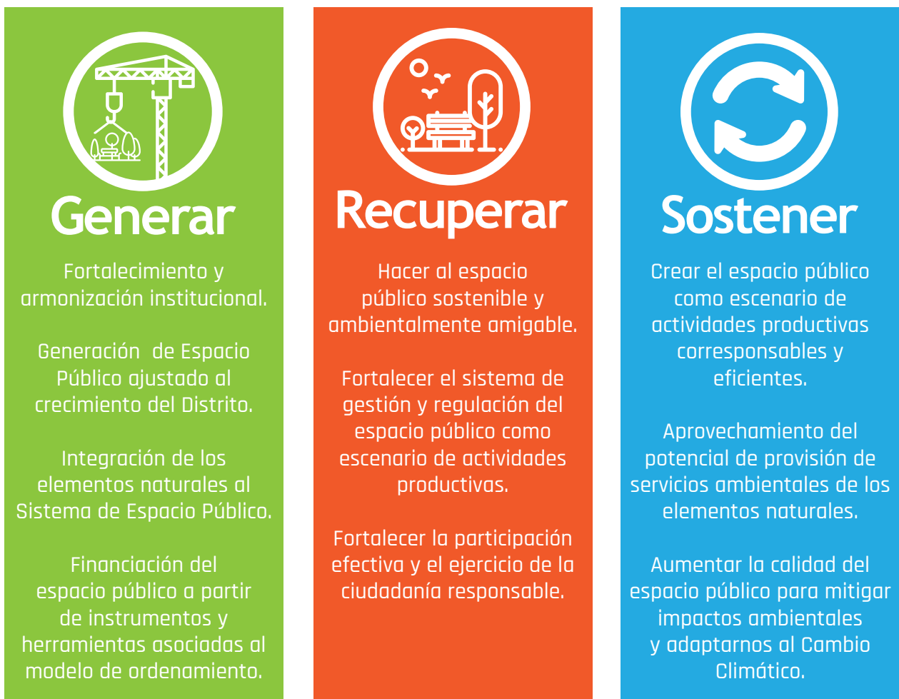
Imagen 5. Retos de las investigaciones.

Las investigaciones, se encuentran enmarcadas dentro de los siguientes retos: