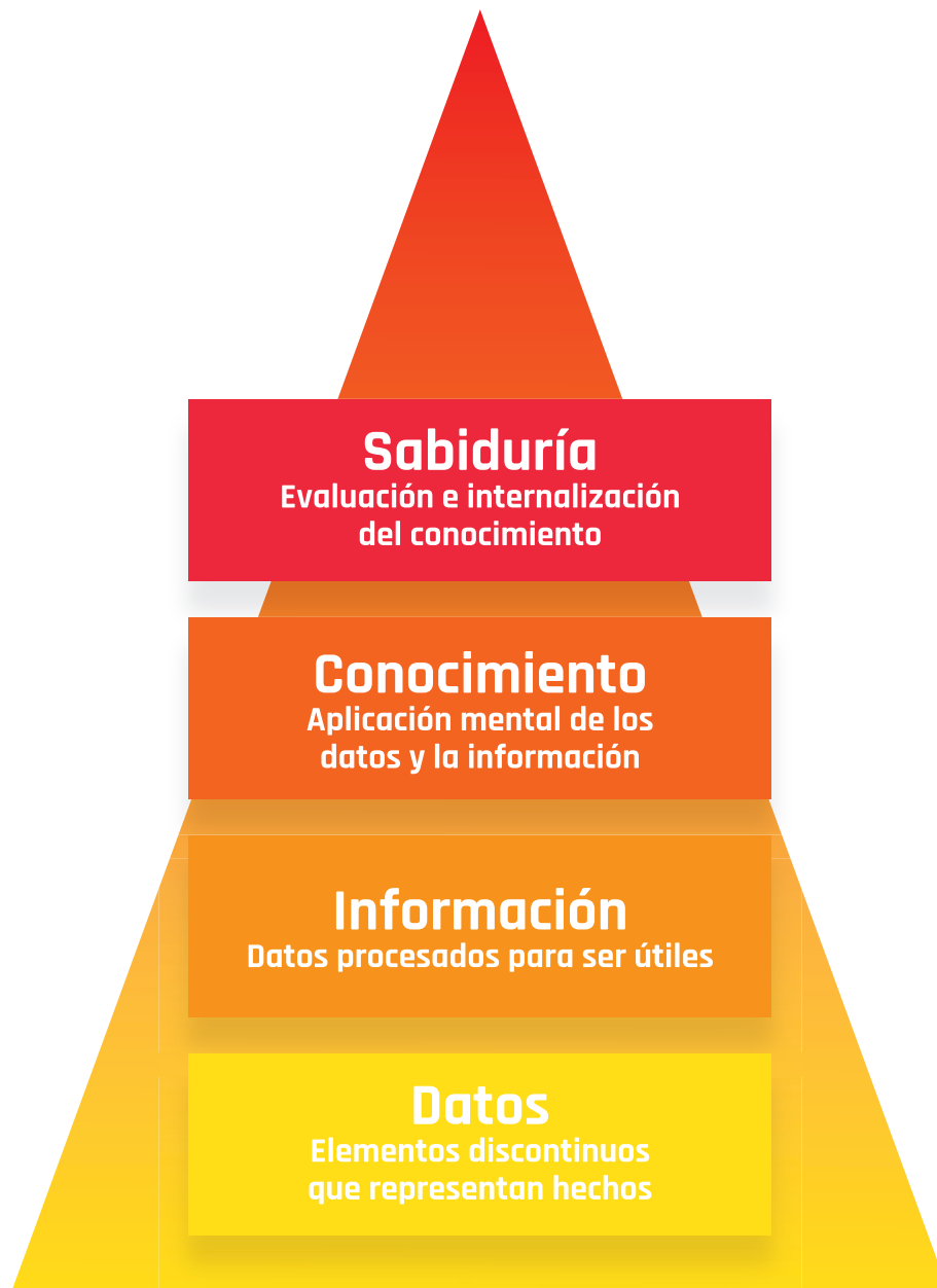
Imagen 4. Pirámide de Datos, Información, Conocimiento y Sabiduría

Ser la instancia líder y el principal referente a nivel distrital en gestión de datos, información y construcción de conocimiento sobre el Espacio Público de Bogotá y servir de modelo a nivel nacional en la implementación de herramientas tecnológicas articuladoras de datos e información fundamentadas en el derecho de acceso a la información por medio de Datos abiertos.